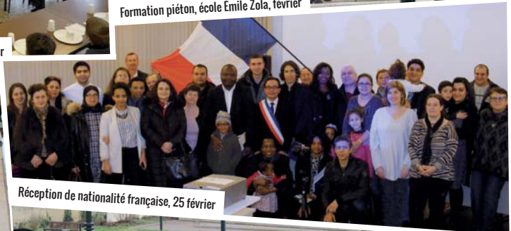
Réception de nationalité française, 25 février