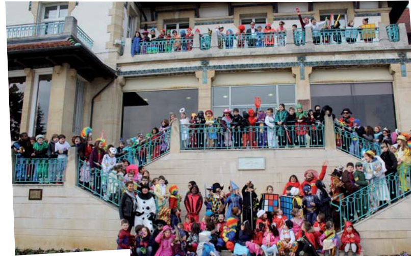
Carnaval, école Emile Zola, mars