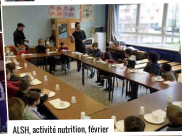
ALSH, activité nutrition, février