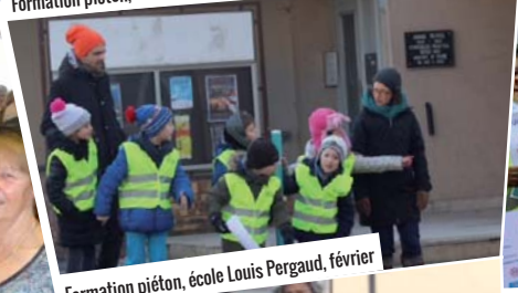
Formation piéton, école Louis Pergaud, février