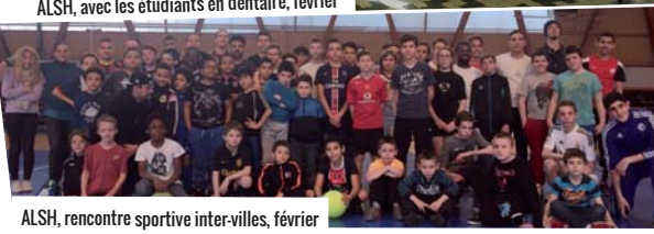
ALSH, rencontre sportive inter-villes, février