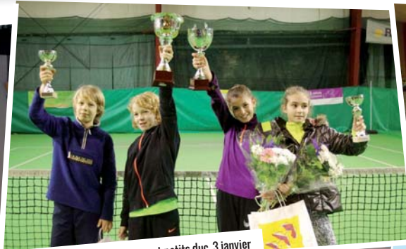
Tournois des petites duchesses et petits duc, 3 janvier