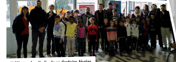
ALSH, avec les étudiants en dentaire, février