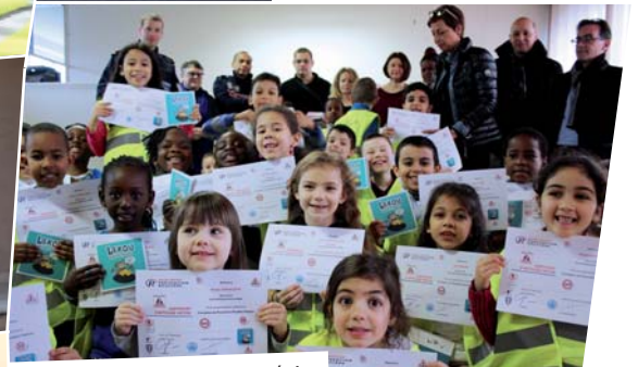
Formation piéton, école Victor Hugo, février