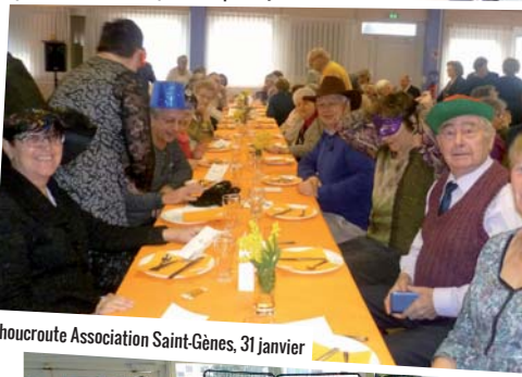
Chaucroute Association Saint-Gènes, 31 janvier