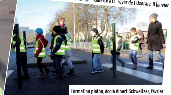
Formation piéton, école Albert Schweitzer, février