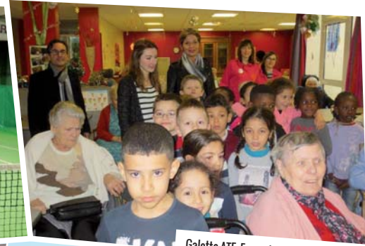
Galette ATE, Foyer de l'Oseraie, 8 janvier