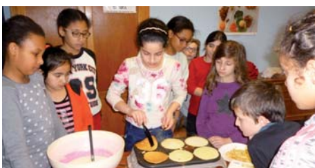
Les « cuisiniers » de l'école Victor Hugo

pour aborder de nouvelles thématiques. C'est ainsi que les enfants de l'activité A.T.E. « Cuisine » de l'école élémentaire Victor Hugo et les jeunes enfants de la garderie périscolaire de l'école maternelle Émile Zola ont fêté la chandeleur.