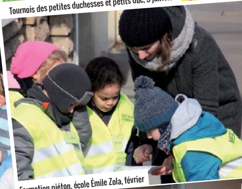
Formation piéton, école Émile Zola, février