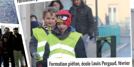
Formation piéton, école Louis Pergaud, février