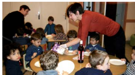
Les enfants de la garderie maternelle Émile Zola

D'autres animations adaptées à chacun et à chaque âge, au gré des fêtes calendaires et des saisons, sont au programme pour les mois à venir.