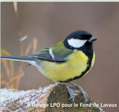
Refuge LPO pour le Fond de Lavaux

LPO : « Nous suivrons l'installation des nichoirs et leur entretien dans les parcs de Laxou ainsi que la signature de la convention "Refuge LPO", entre la LPO et la ville de Laxou concernant le parc du Fond de Lavaux. Un des volets de la convention prévoit un recensement de l'avifaune ("diagnostic patrimonial du site") qu'il faudra donc réaliser à l'avenir. Un refuge LPO est un agrément de la LPO mettant en valeur des espaces qui préservent et développent la biodiversité tout en offrant à l'homme une meilleure qualité de vie. Cela implique le respect d'une charte comme créer des conditions propices à l'installation de la faune et de la flore sauvages, renoncer aux produits chimiques, réduire son impact sur l'environnement... ».