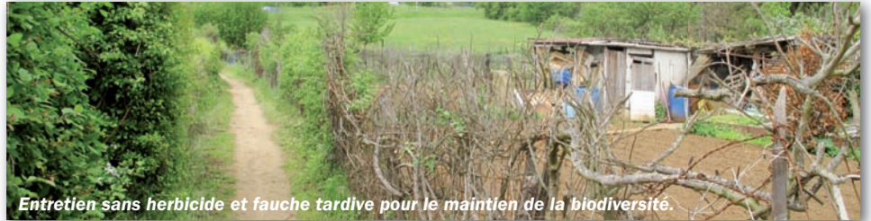
Entretien sans herbicide et fauche tardive pour le maintien de la biodiversité.

La présentation ci-dessous donnera un éclairage pédagogique à ceux qui propagent des rumeurs malveillantes de mauvais traitement des sentiers par la commune !