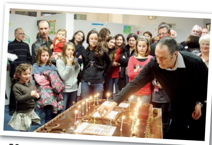
20 ans de la bibliothèque-médiathèque Gérard Thirion.