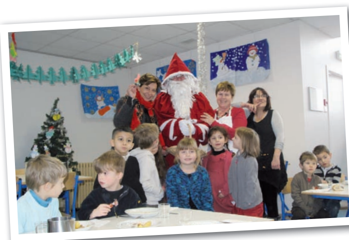
Noël à la cantine.