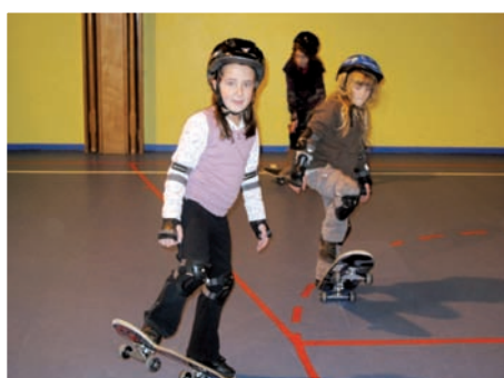
« C'est bien de faire du skate car on n'en a pas chez nous et là, ça nous apprend bien ! »

Promesse tenue puisque depuis cette rentrée, la couture, le tir à l'arc et les sports extrêmes (en toute sécurité !) ont pris place dans le panel d'activités proposées aux enfants, pour leur plus grand plaisir.