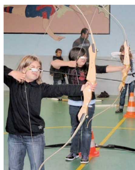
« L'animateur est sympa et j'aime bien faire du tir à l'arc. L'animateur nous explique bien comment on fait...et ce qui est bien c'est que c'est un sport mixte ! »