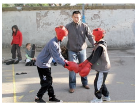
« La boxe, c'est bien d'en faire avec un animateur parce que comme ça, on apprend plus vite et en plus, on a tout le matériel pour ne pas se faire mal »