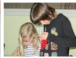
« J'aime bien parce qu'on apprend des choses, et je pourrai en faire chez moi après. L'animatrice est super trop bien, elle est coool et on apprend en s'amusant »