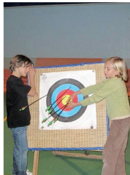
« J'aime bien tirer car c'est un jeu. Il faut être prudent et rester derrière la ligne de sécurité. C'est un sport un peu dangereux mais c'est intéressant »