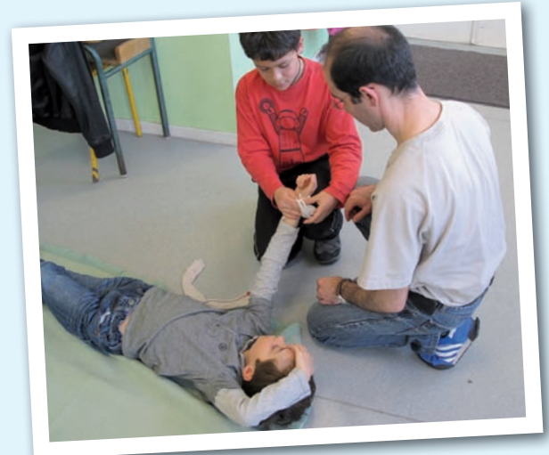
Réalisation de bandage