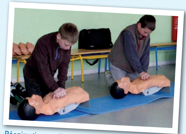
Réanimation cardio-pulmonaire : massage cardiaque