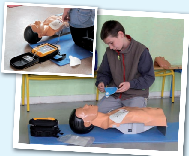
Utilisation du défibrillateur : comment brancher les électrodes