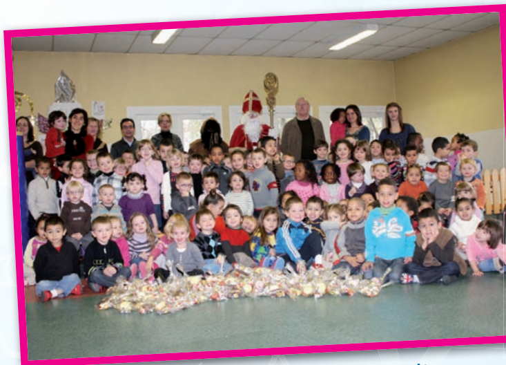
Ecole préélémentaire Albert Schweitzer