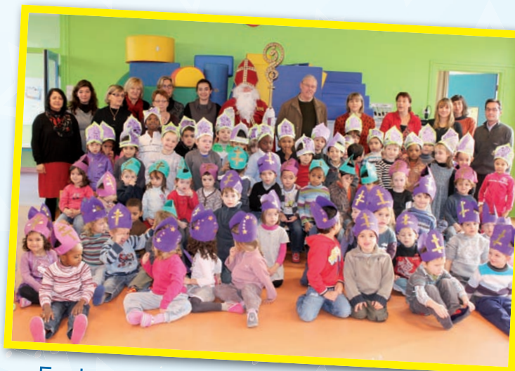
Ecole préélémentaire Victor Hugo