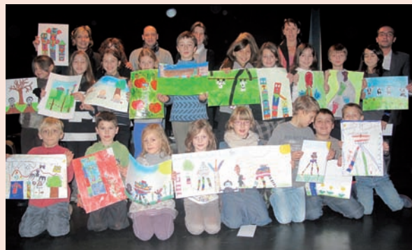
Les élèves ont participé au concours de dessins de la « Balade en Couleurs ».

Un grand merci à l'ensemble de nos partenaires, aux propriétaires et locataires de jardins, qui ont contribué à sa réalisation et rendez-vous en 2013 !