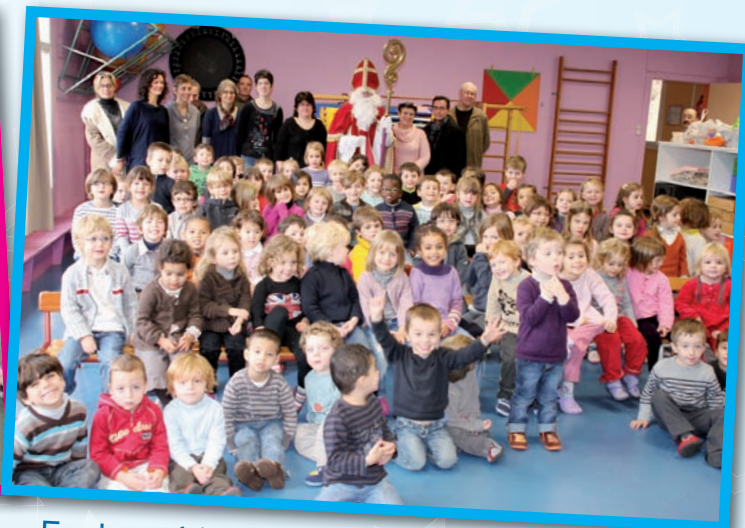
Ecole préélémentaire Louis Pergaud