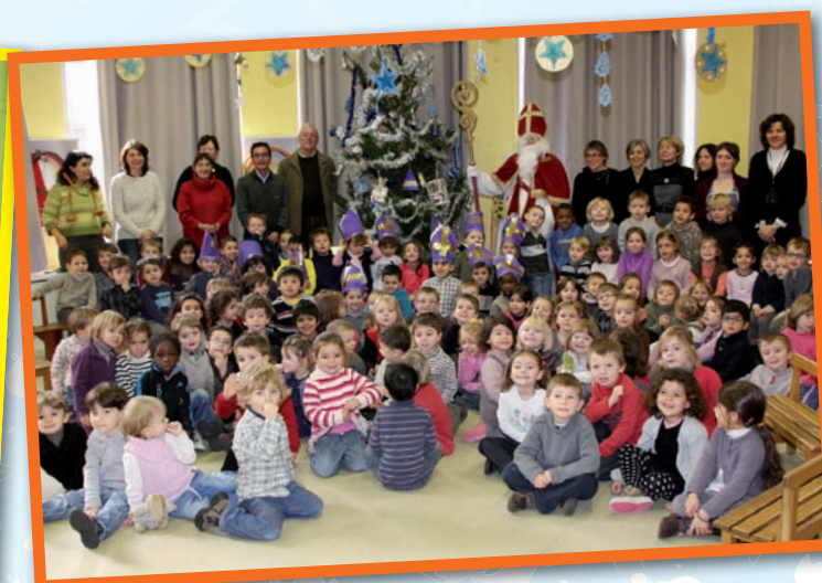
Ecole préélémentaire Emile Zola