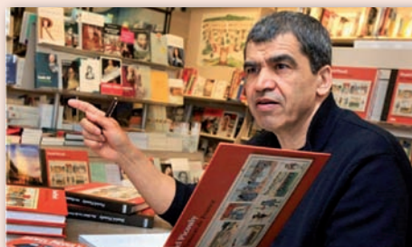
Daniel Picouly – écrivain des séries de Lulu Vroumette.

Dans le cadre du salon littéraire « le Livre sur la Place » qui se déroule du 14 au 16 septembre à Nancy, Daniel PICOULY, écrivain à succès, récompensé par plusieurs prix prestigieux, retrouvera des enfants des écoles Emile Zola et Victor Hugo