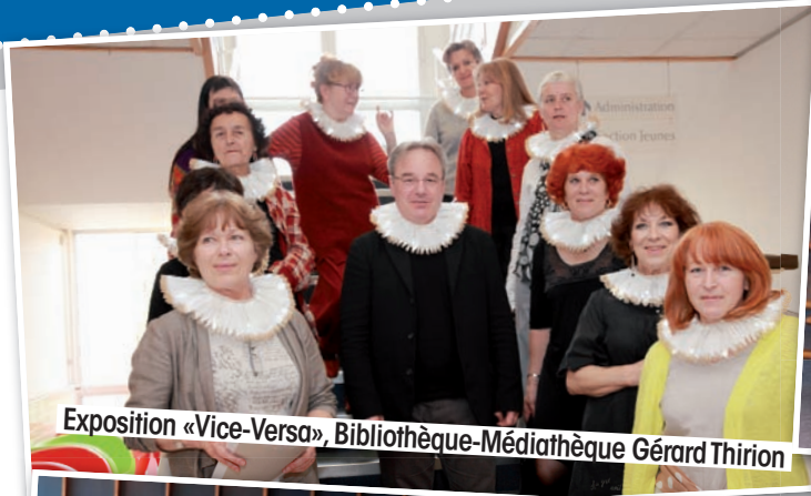
Exposition «Vice-Versa», Bibliothèque-Médiathèque Gérard Thirion