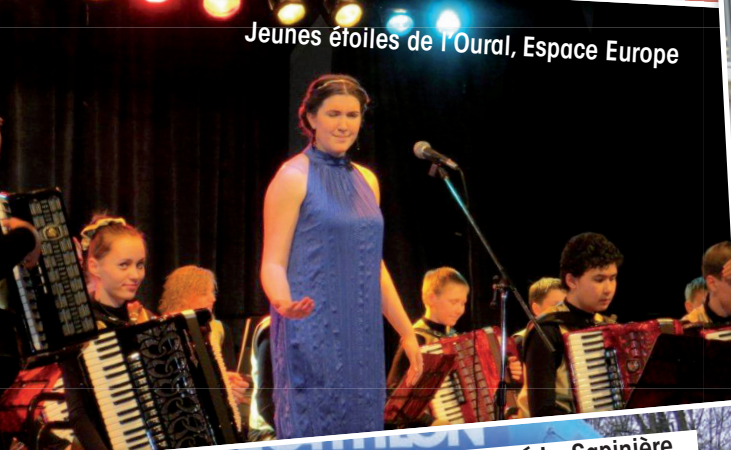
Jeunes étoiles de l'Oural, Espace Europe