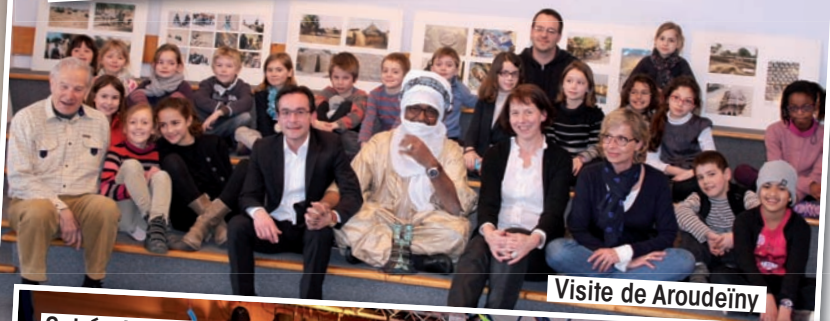
Visite de Aroudeïny