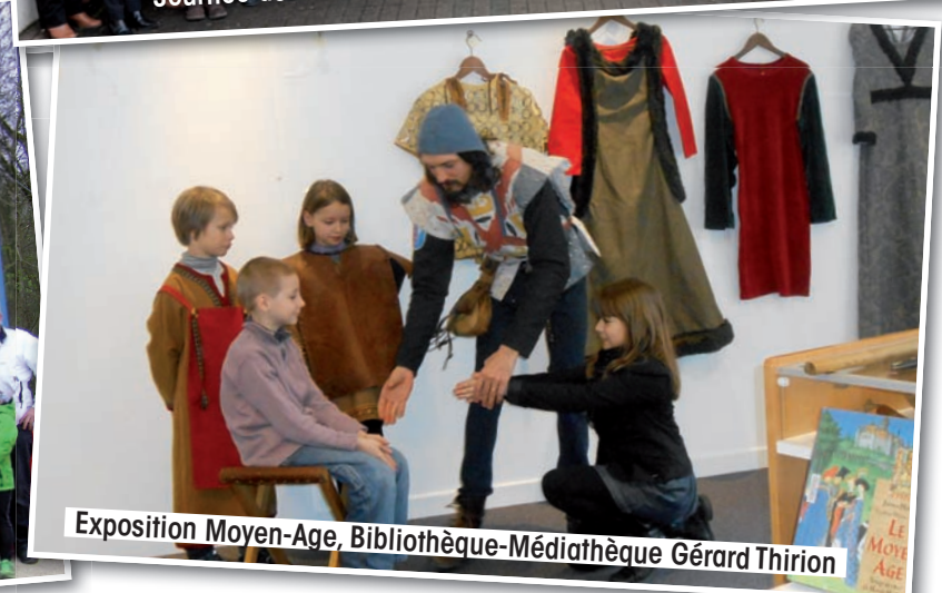
Exposition Moyen-Age, Bibliothèque-Médiathèque Gérard Thirion