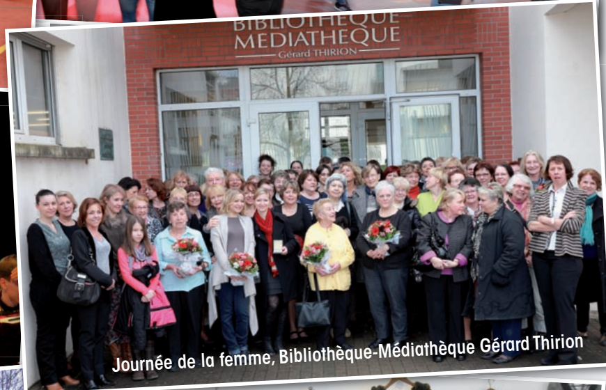
Journée de la femme, Bibliothèque-Médiathèque Gérard Thirion