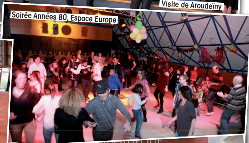
Soirée Années 80, Espace Europe