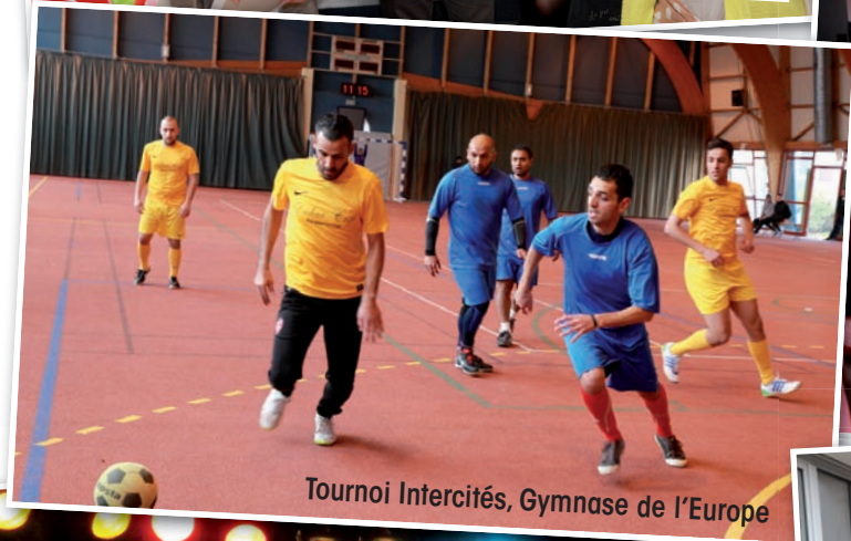
Tournoi Intercités, Gymnase de l'Europe