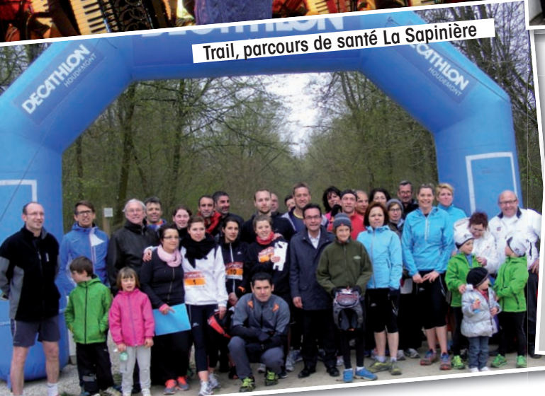
Trail, parcours de santé La Sapinière