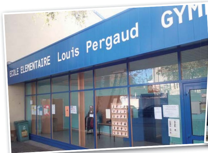
Bardage Gymnase Louis Pergaud