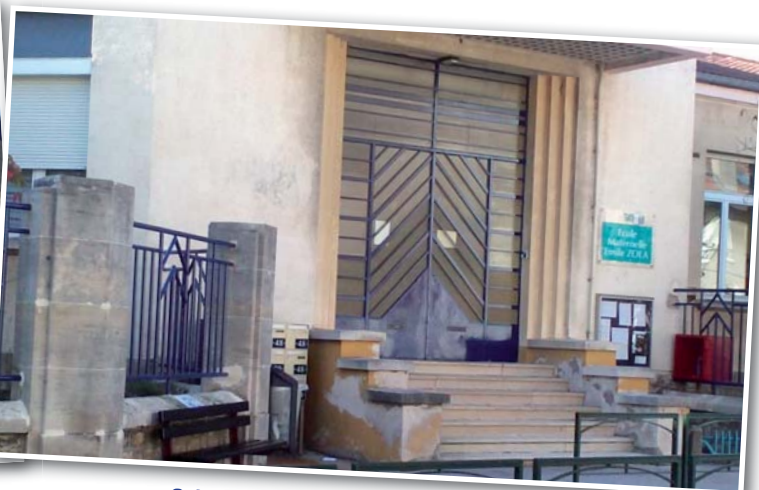
Grilles et portes Maternelle Emile Zola